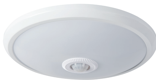
FOGLER LED 14W-NW