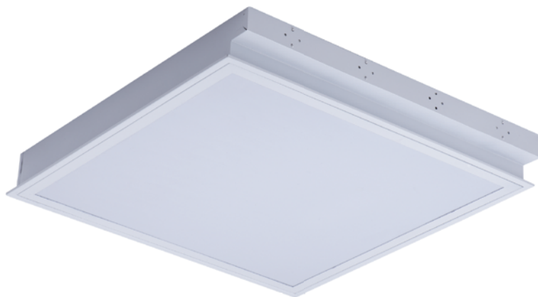
REGIS 3 OPAL 418 PT