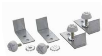
CLP-REGIS 418 PT