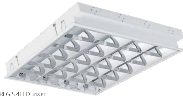
REGIS 4LED 418 PT