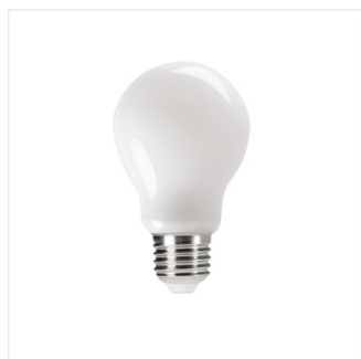
XLED A60 4,5W; 7W; 8W; 10W NW; WW; CW - M