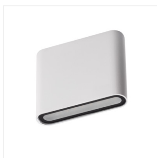
GARTO LED EL 8W-W