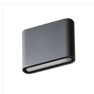
GARTO LED EL 8W-GR