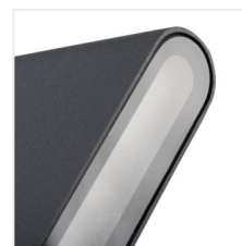
GARTO LED EL 8W-GR