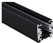
33233 TEAR N TR 2M-B

Elemento di sistema a sbarra, TEAR N TR 2M-B, sbarra colletttrice a 3 circuiti, nero, (33233)