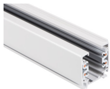
33232 TEAR N TR 2M-W

Elemento di sistema a sbarra, TEAR N TR 2M-W, 3 circuiti, bianco, (33232)